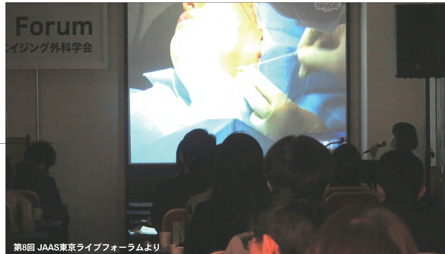
第8回 JAAS東京ライブフォーラムより

製造特性、形状、適用そしてリフティング法など代表的な「Thread美容形成術」を一堂に集めて、来日の海外スピーカーと国内医師が講演とライブ供覧の中継をします。 当日参加者のみに糸資材の供給特典～新たなJAAS会員も含め 公開フォーラムで100席を用意しました。